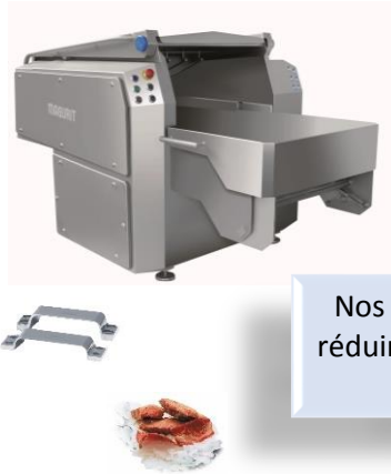
Nos Grignoteuses pour réduire les blocs congelés de produit