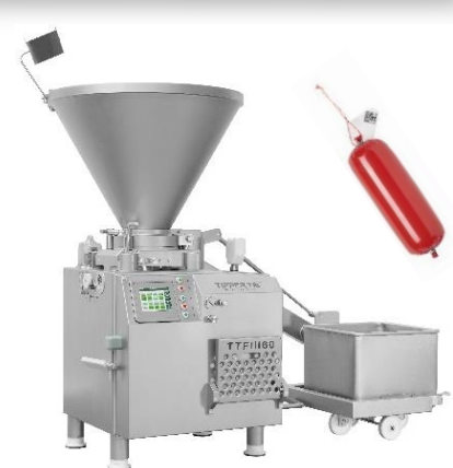
Nos Pousseurs sous-vide et nos Clippeuses automatiques pour conditionner les produits pâteux ou liquides sous boyaux