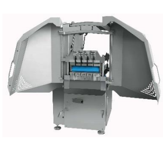
Nos Guillotines pour le tranchage et le cubage de blocs congelés