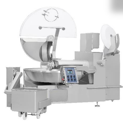
Nos Cutters pour broyages, réductions et émulsions de tous vos produits et ingrédients. Idéal pour terrines, pâtés, croquettes et granulés